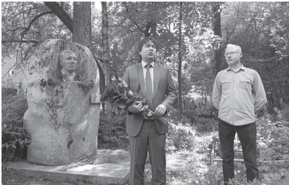
Бюст Григория Бумагина появился на Богословском кладбище в начале восьмидесятых. Но в девяностые годы неизвестные вандалы уничтожили памятник... Справедливость восстановили спустя 30 лет

Партизанские силы области на тот момент насчитывали около 14 тысяч человек. Этим людям ждал трудный подвиг. Ленинград оказался в кольце блокады, продовольствия на местах не хватало, да ещё и зима 1941-1942 годов выдалась по-настоящему суровой. Захватчики лютовали и