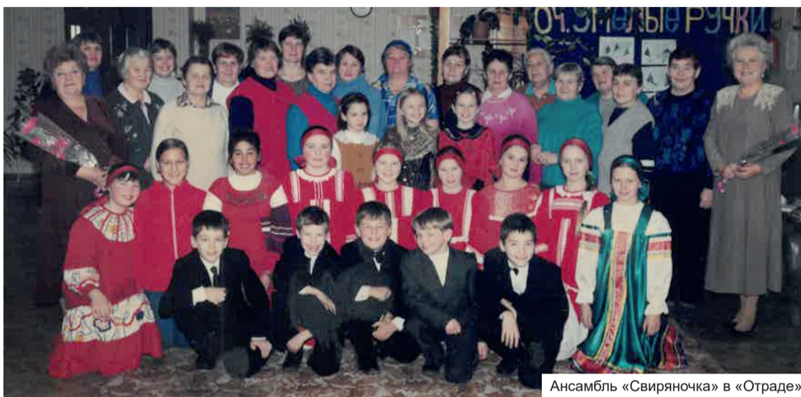
Ансамбль «Свириночка» в «Отраде»