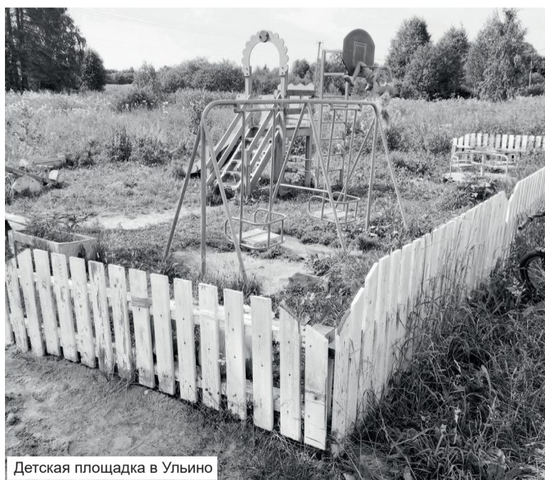
Детская площадка в Улыно