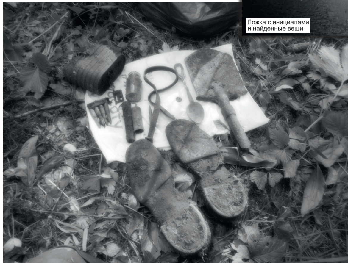
Ложка с инициалами и найденные вещи