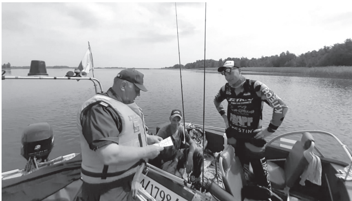
Во время рейдов инспекторам регулярно встречаются и законопослушные судоводители

Кстати, совместные рейды с полицейскими обусловлены