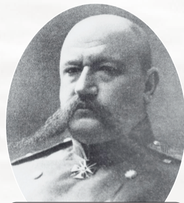
Николай Николаевич Юденич, русский военный деятель, генерал от инфантерии. Действовал против большевиков