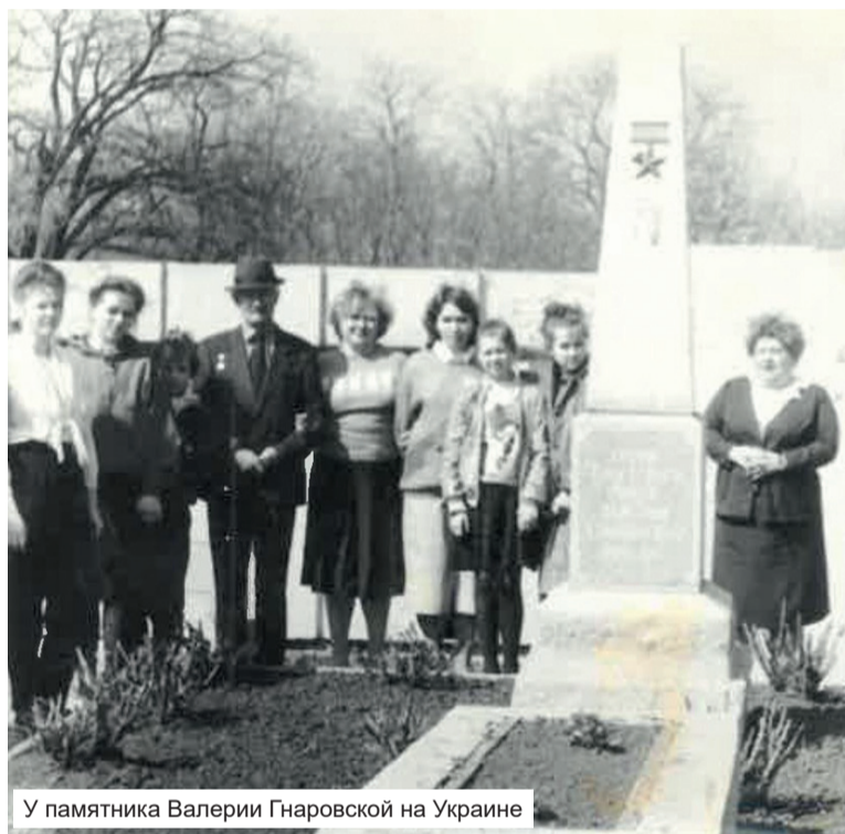
У памятника Валерии Гнаровской на Украине