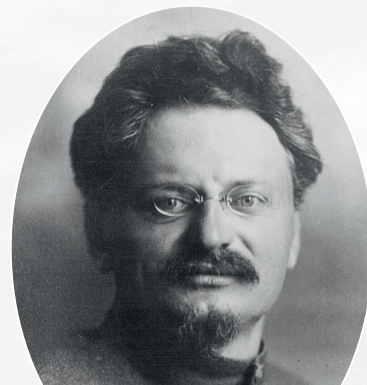
Лев Давидович Троцкий, российский революционер, государственный, партийный и военно-политический деятель

Все эти мероприятия Советской власти, признанные вскоре ошибочными, были не только не популярны в деревне, но и полыхнули крестьянскими восстаниями. Летом 1918 года в Петроградской губернии началась гражданская война. В августе 1918 года вспыхнуло 37 антисоветских мятежей, шесть из которых были подавлены с помощью оружия. Ингрия, заселенная в основном крепкими середняками-единоличниками как финнами, так и русскими, разделилась на красных и белых. Крестьянские восстания, начавшись в Волосовской и Моло-сковичской волостях Ямбургского уезда, быстро перекинулись в соседние волости. Восставшие взяли станции Волосово и Вруда и перерезали Балтийскую железную дорогу. Бои шли около недели. Председатель Реввоенсовета республики Лев Троцкий снял с фронта регулярные войска 7-й армии. Восстания докатились до Красного Села, Лигова, Пулкова, затронули Староскворицкую и Дудергофскую волости Царскосель-