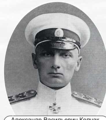
Александр Васильевич Колчак, русский государственный, политический и военный деятель, руководитель Белого движения

Ситуация усугублялась тем, что к марту 1918 года усилиями германских оккупационных войск и националистических формирований была свергнута советская власть в Прибалтике, на смену ей пришли