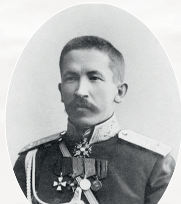
Лавр Георгиевич Корнилов, генерал от инфантерии, участник Корниловского мятежа

предопределил глубочайший кризис временного правительства, привёл к фактическому параличу центральной и особенно местной власти (уездных управ). Военная разруха и революционный беспорядок усугубили глубочайший экономический кризис, жертвами которого стали и сельское хозяйство губернии, и рыболовная отрасль, и особенно