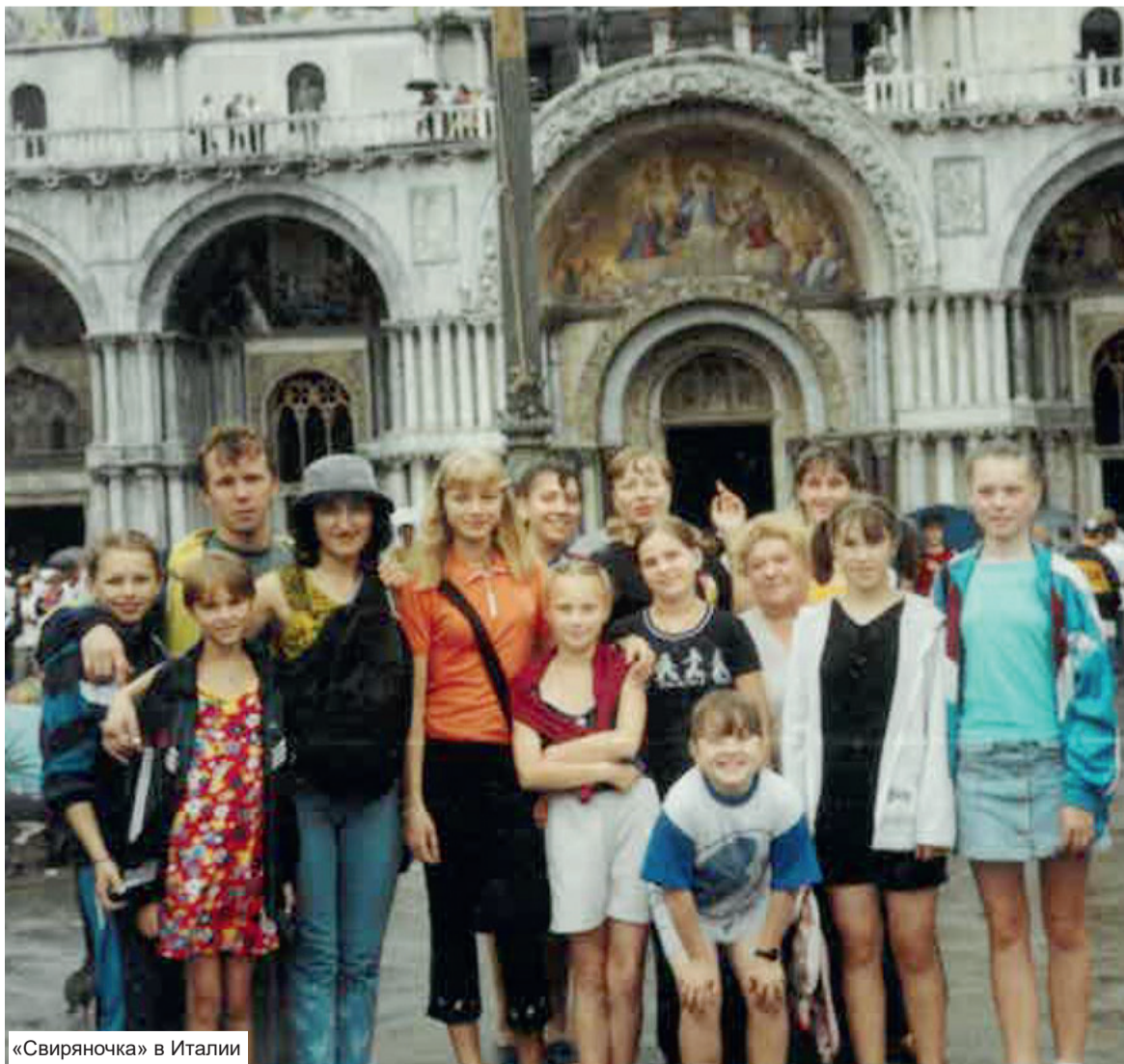
«Свириночка» в Италии