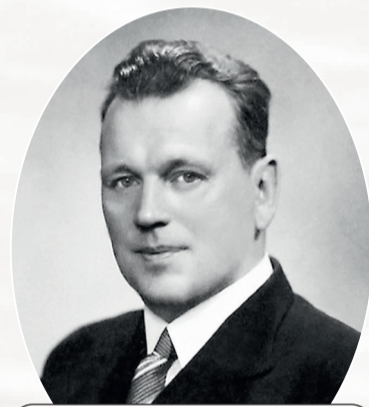
Фёдор Фёдорович Раскольников, полпред нескольких стран, советский военный и государственный деятель, дипломат.

В этой связи командование флотом решило, прежде всего, использовать наименее изношенные и наиболее боеготовые корабли. Был создан так называемый Действующий отряд Балтийского флота. В его состав вошли линейные корабли – дредноут «Петропавловск» и додредноутный линкор «Андрей Первозванный», устаревший крейсер «Олег», новейшие турбинные эскадренные миноносцы